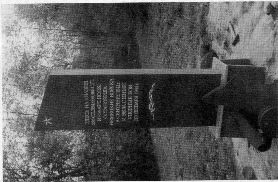
Памятник воинам 286-й на берегу р. Нази

перешли к обороне. Фронт здесь установился по реке Нази вплоть до 27 августа 1942 года, когда началась 3-я синявинская операция, о чем будет рассказано во второй части книги.