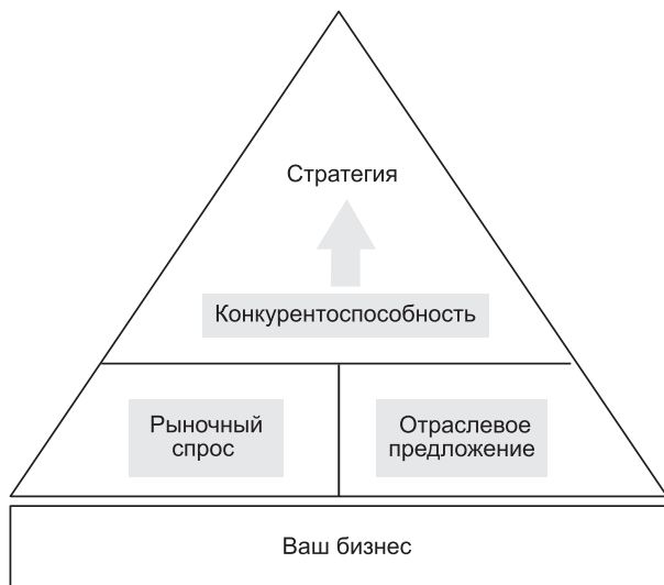
Рис. 0.4. Рассматривайте стратегию как результат конкурентного анализа...