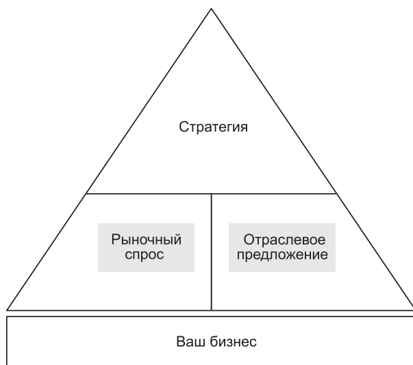
Рис. 0.3. ...или в контексте спроса и предложения

дует анализировать по отдельности. Неспособность их разделить может привести к беспорядочному толкованию происходящего. Инструменты, используемые для анализа каждой составляющей, совершенно различны. И каждый их набор в равной степени важен. Поэтому макроэкономический строительный блок можно разделить на две части (см. рис. 0.3).