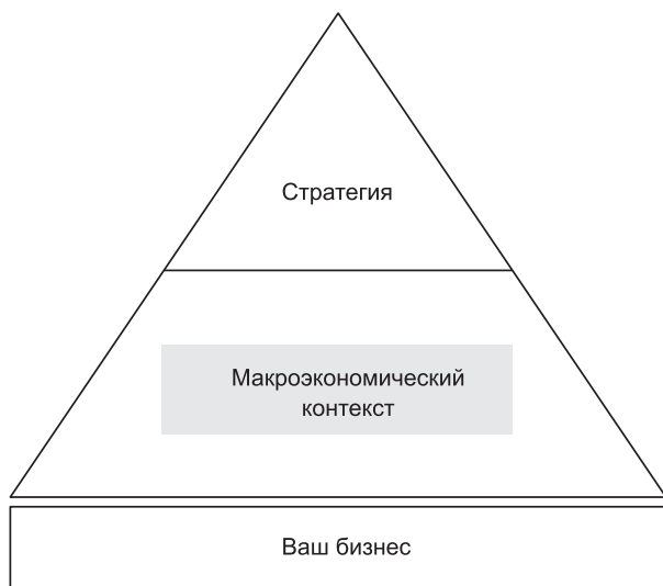
Рис. 0.2. Создавайте свою стратегию в макроэкономическом контексте...

В макроэкономике имеются две основных составляющих: рыночный спрос и отраслевое предложение, каждую из которых сле-