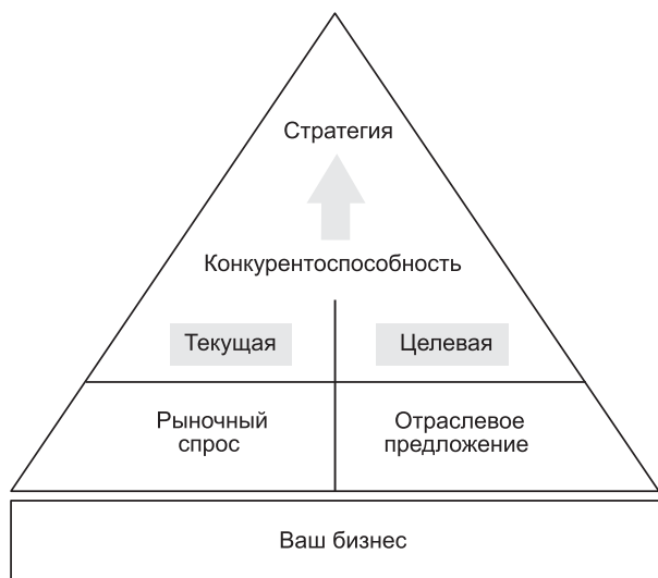
Рис. 0.5. ...как текущего положения, так и того, каким оно будет, по вашей оценке, в будущем

могут быть разными: чтобы обосновать существование своего бизнеса, добиться максимального роста прибыли, сохранить рабочие места для своего персонала, удовлетворять запросы самых разных заинтересованных сторон. Эти взаимно перекрывающиеся друг друга цели очень важны для процесса разработки стратегии и входят в состав фундамента пирамиды стратегии (см. рис. 0.6).