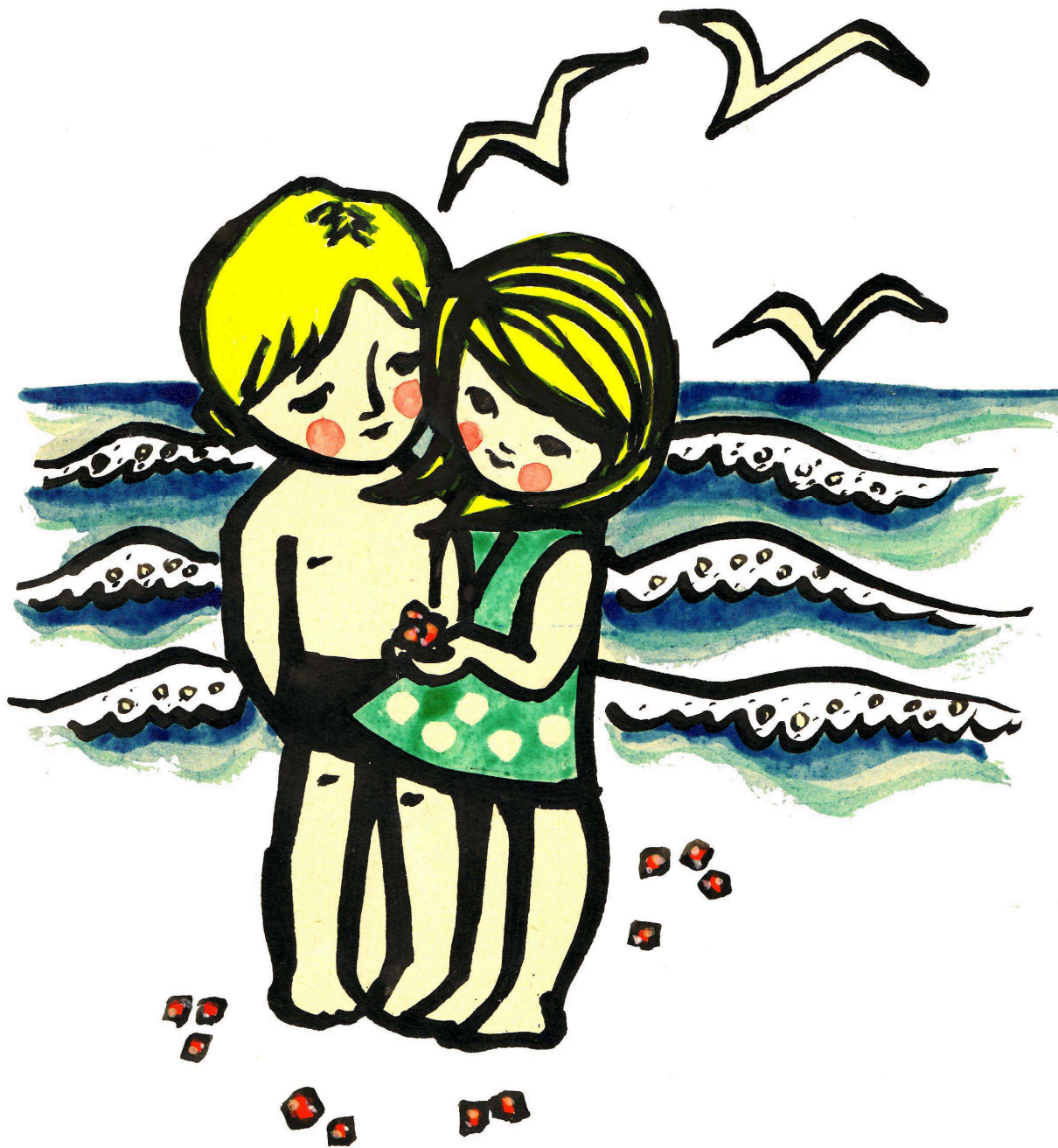
Морские камушки (копия с открытки)